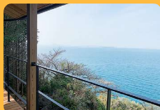
2021年に完成したサテライトオフィ スからは、瀬戸内海を一望できる