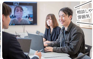
左)作業スケジュールは常に細かく確認。日々の業務内容を明確にすることを大事にしている 右)円滑にコミュニケーションをとりながら一丸となって業務に取り組む