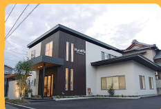
愛媛本社は一見カフェのような外 観で、オシャレな内装も自慢