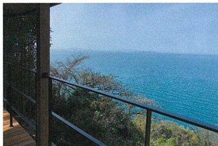
ふたみサテライトオフィス(写真は窓からの景色)